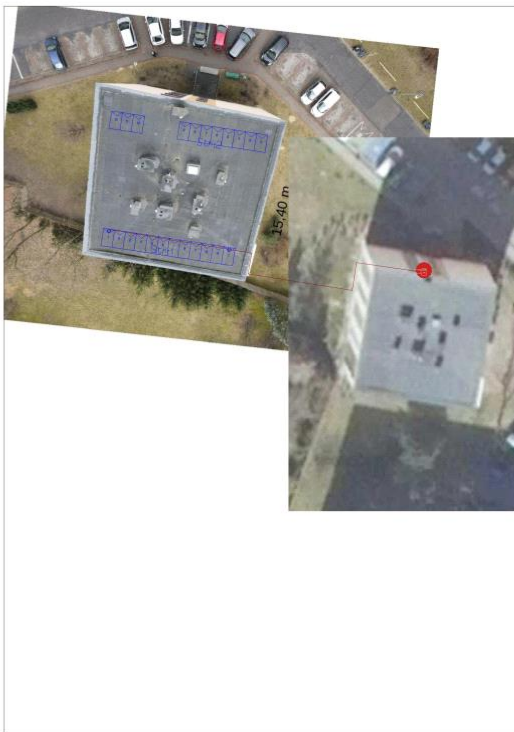
Figura 2: Umieszczenie generatora fotowoltaicznego i grupy konwersji