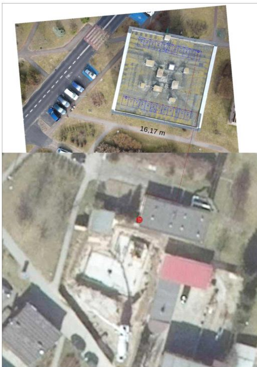
Figura 2: Umieszczenie generatora fotowoltaicznego i grupy konwersji