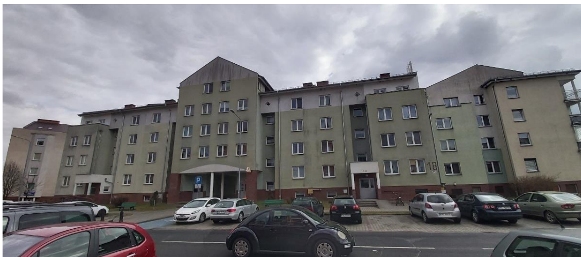
Rysunek 8. Budynek na Os. Wojska Polskiego 18A