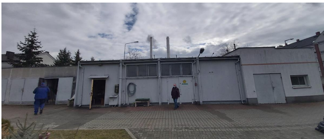
Rysunek 9. Budynek kotłowni Tropicco