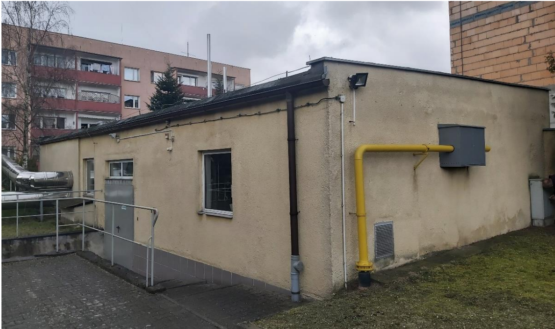
Rysunek 4. Budynek kotłowni 727 na dz. nr 506/15