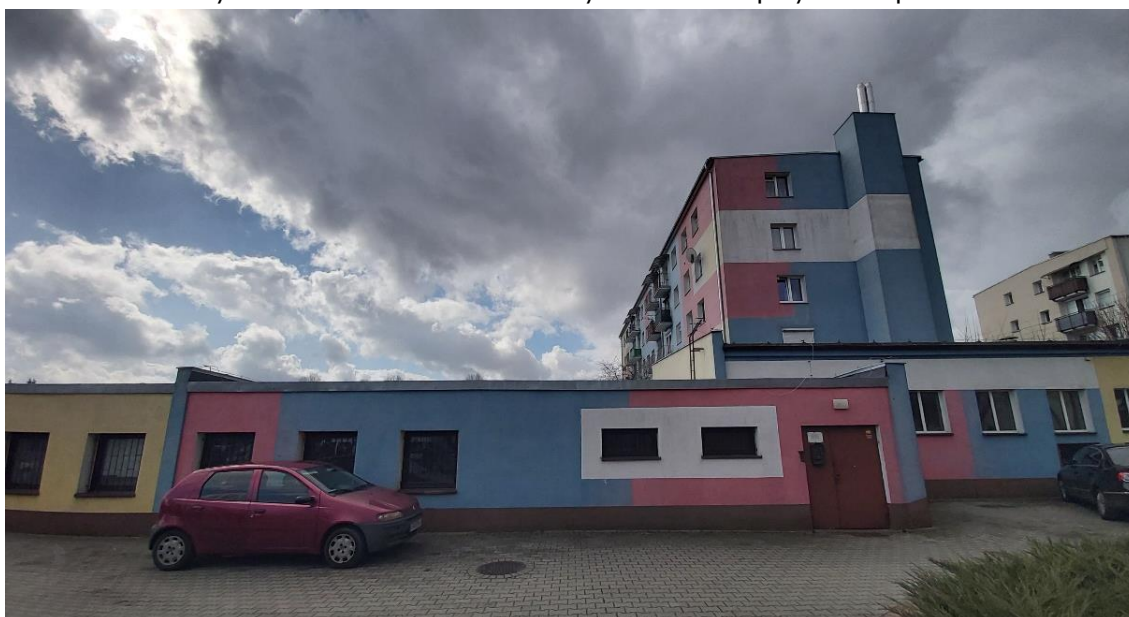
Rysunek 3. Budynek kotłowni przy ul. Chopina 20