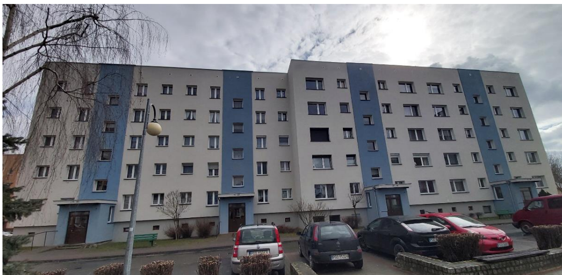
Rysunek 6. Budynek na Os. Wojska Polskiego 11 (źródło: materiał własny)