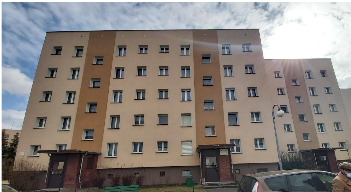
Rysunek 5. Budynek na Os. Wojska Polskiego 5