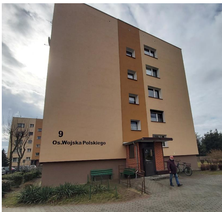
Rysunek 7. Budynek na Os. Wojska Polskiego 9