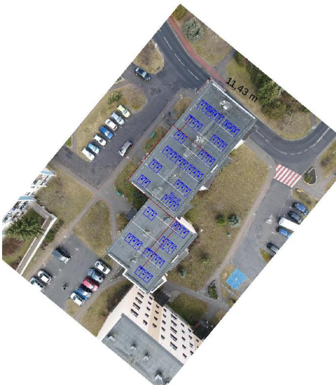
Figura 2: Umieszczenie generatora fotowoltaicznego i grupy konwersji