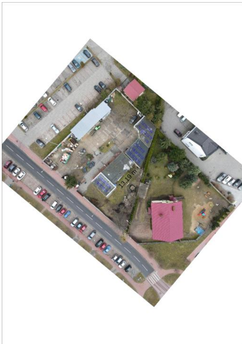
Figura 2: Umieszczenie generatora fotowoltaicznego i grupy konwersji