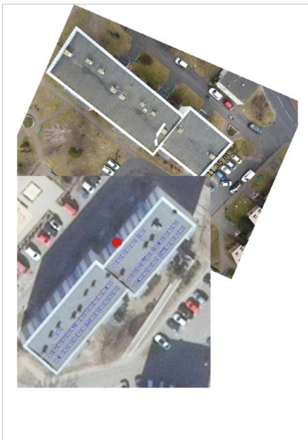
Figura 2: Umieszczenie generatora fotowoltaicznego i grupy konwersji