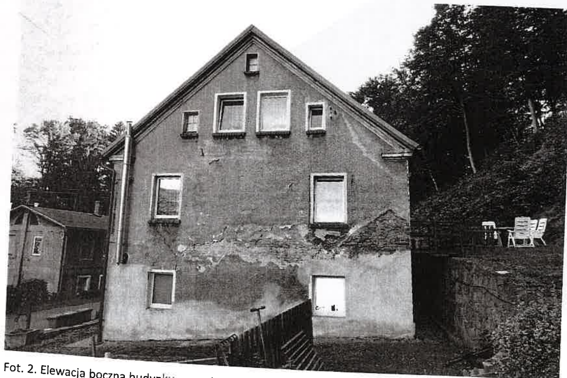
Fot. 2. Elewacja boczna budynku przy ul. Bolesława Chrobrego 10 w Głuszycy.