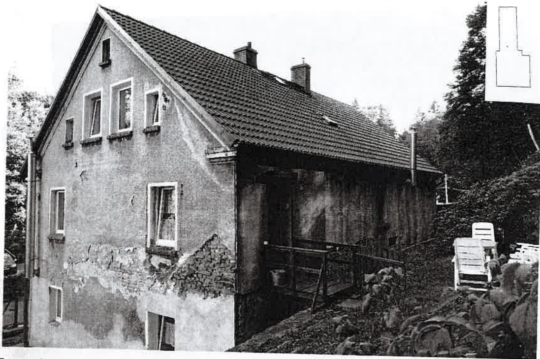
Fot. 3. Elewacja boczna i tylna budynku przy ul. Bolesława Chrobrego 10 w Głuszycy.