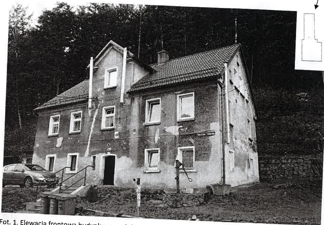
Fot. 1. Elewacja frontowa budynku przy ul. Bolesława Chrobrego 10 w Głuszycy.